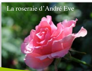
La roseraie d'André Eve